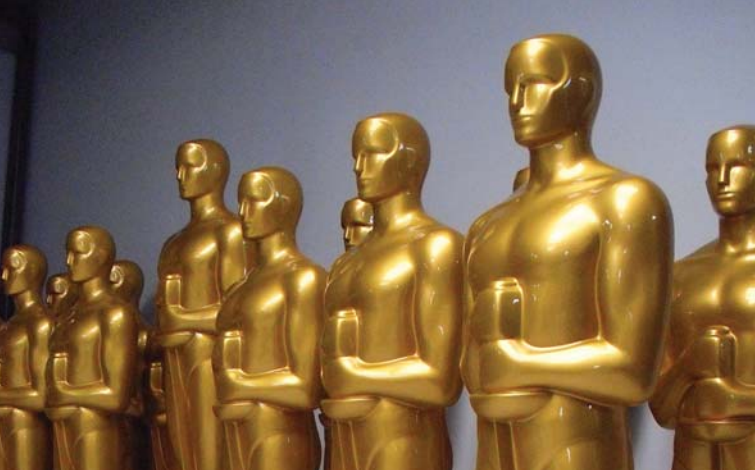
Goldene Filmpreisfiguren, 2 m hoch