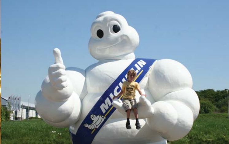
Michelin-Mann, 3,5 m hoch