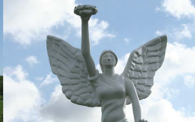
Princes Gates Statue aus GFK für ein Springturnier