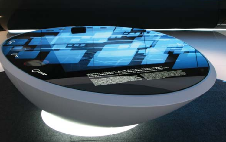
Multifunktionstische für Audi auf der IAA