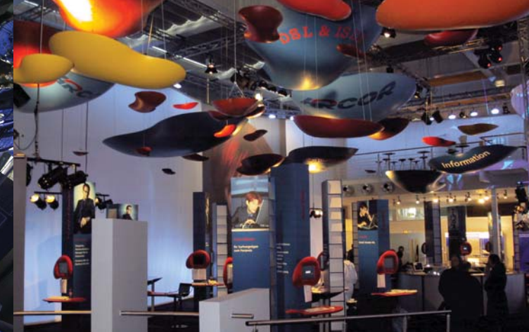
Dreidimensionale Flake-Objekte für die CeBIT