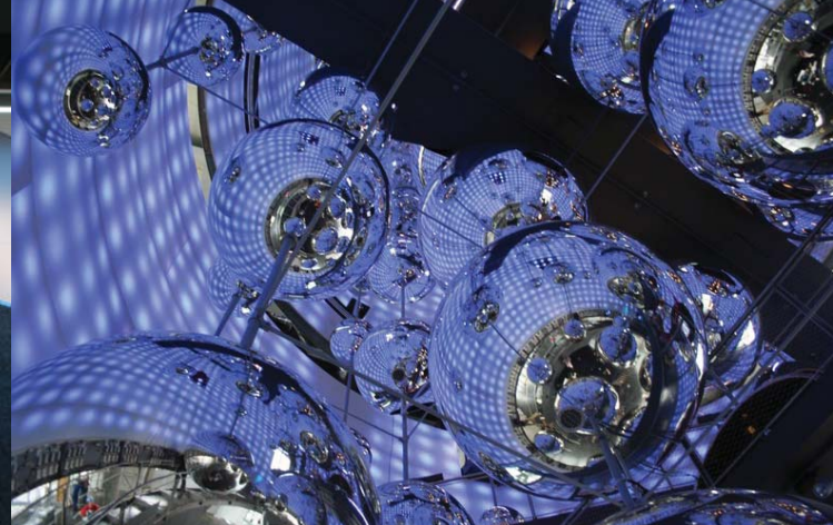
Voestalpine Besucherzentrum in Linz, 80 Kugeln ø 1–2,5 m